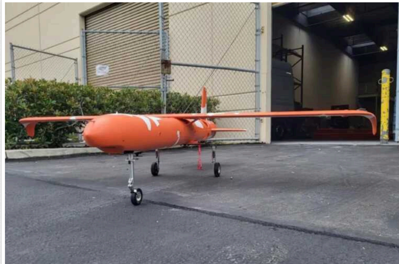
Стартап із США створить мініфабрики для швидкого 3D-друку бойових дронів

Американський стартап із Сан-Дієго Firestorm Labs працює над дешевими та мініатюрними фабриками з 3D-друку безпілотників, які зможуть використовуватися в зонах бойових дій, зокрема в Україні. Компанії вже вдалося залучити 12 мільйонів доларів від таких спонсорів, як Lockheed Martin – однієї з найбільших американських військово-промислових корпорацій.