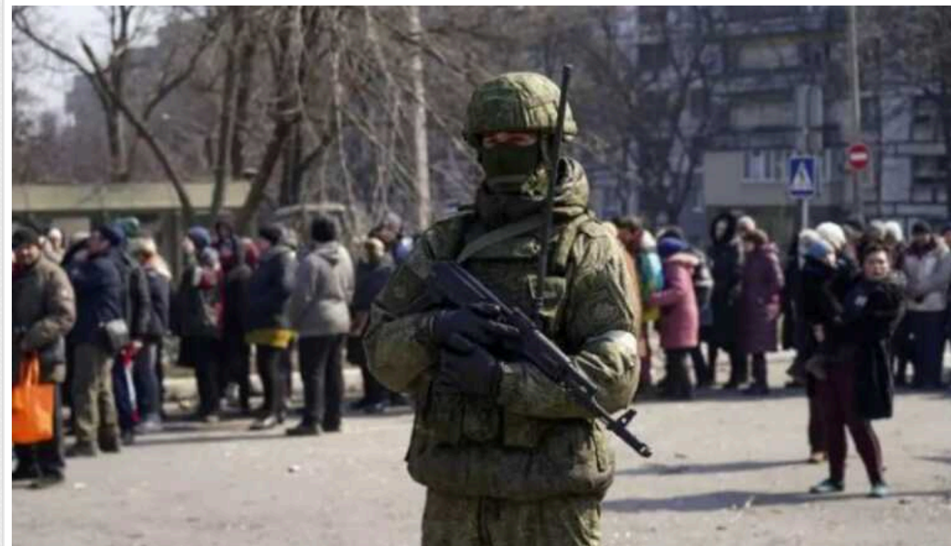
Британська розвідка вказала на загрозу для українців на ТОТ: можуть відправити до віддалених областей РФ

Держава-терорист Росія змусила майже три мільйони українців отримати так звані "паспорти РФ". При цьому людей, які відмовилися від фейкових документів, агресор вважатиме "іноземними громадянами чи особами без громадянства".