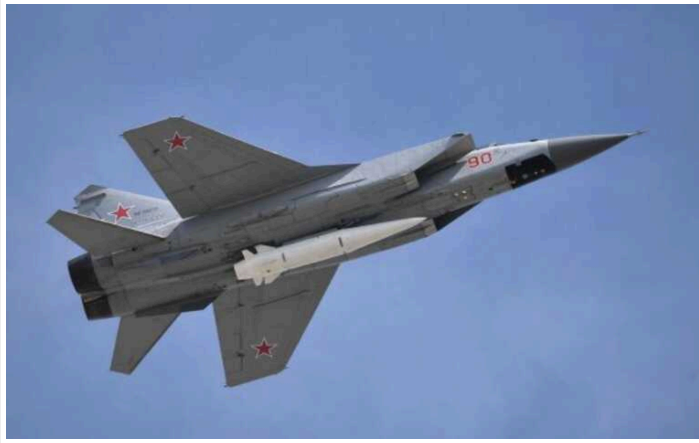
Україна хоче конфіскувати майно виробника російських "Кинджалів" і гелікоптерів

Українська сторона звернулася до Вищого антикорупційного суду з проханням конфіскувати майно російської компанії, яка займається виробництвом ракет "Кинджал".