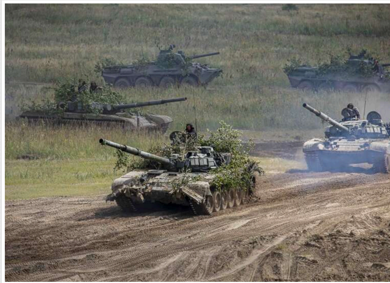
Ситуація на фронті: сталося 216 боєзіткнень, найгарячіше – на Покровському та Гуляйпільському напрямках

Розпочалася 1550-та доба широкомасштабної збройної агресії РФ проти України. Загалом протягом минулої доби зафіксовано 216 бойових зіткнень.