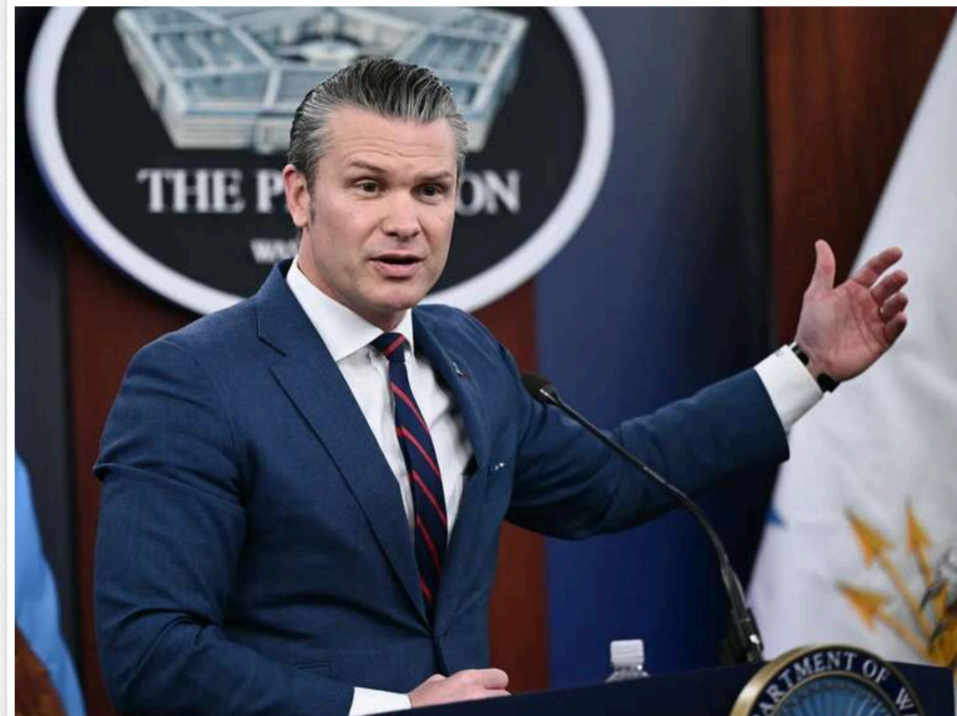
Сенатори США вимагають від Пентагону негайно передати Україні 400 мільйонів доларів допомоги

Двопартійна група сенаторів США заклкала главу Пентагону Піта Гегсета негайно перерахувати 400 мільйонів доларів допомоги Україні.