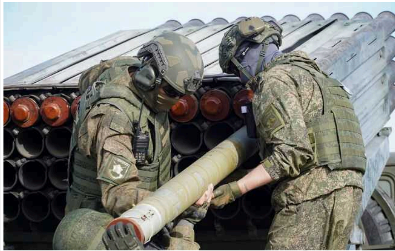
Окупанти на Оріхівському напрямку шукають нові точки для наступу