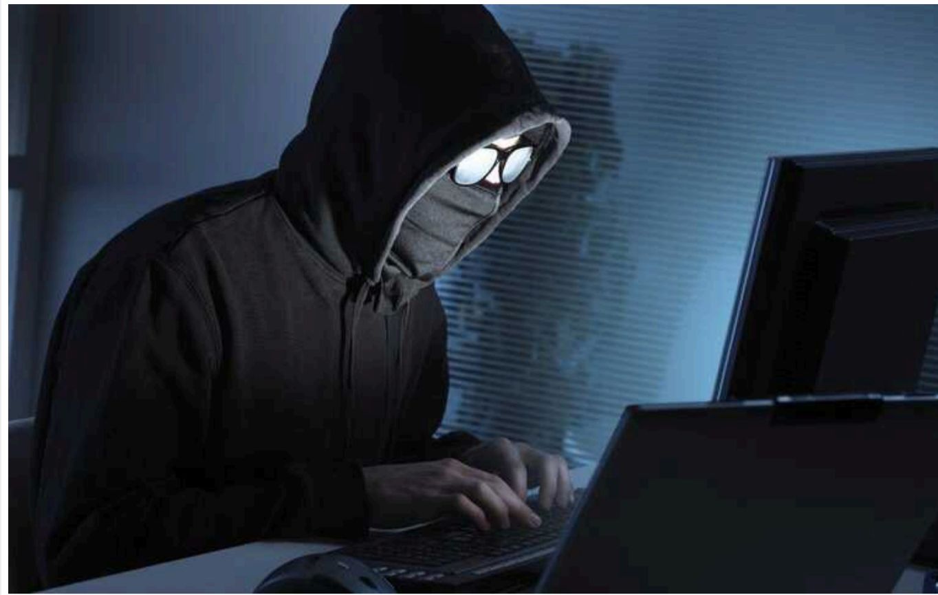
Урядові відомства Франції були атаковані хакерами

Кілька урядових установ Франції стали об'єктами комп'ютерних атак, технічні методи яких є стандартними, але інтенсивність - безпрецедентною.