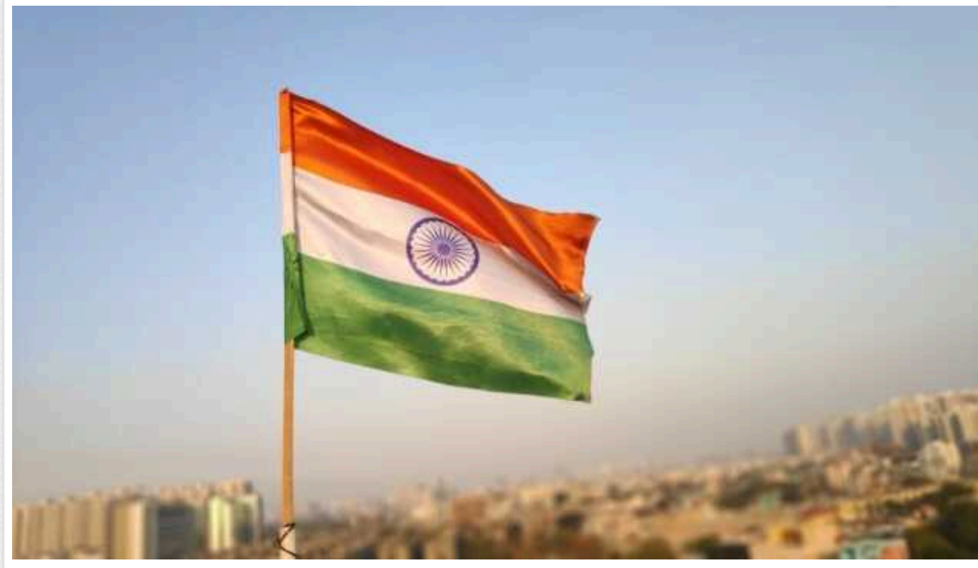
Декілька європейських країн вкладають в Індію 100 мільярдів доларів

Чотири держави Європи пообіцяли протягом 15 років спільно інвестувати в економіку Індії близько 100 млрд дол США.