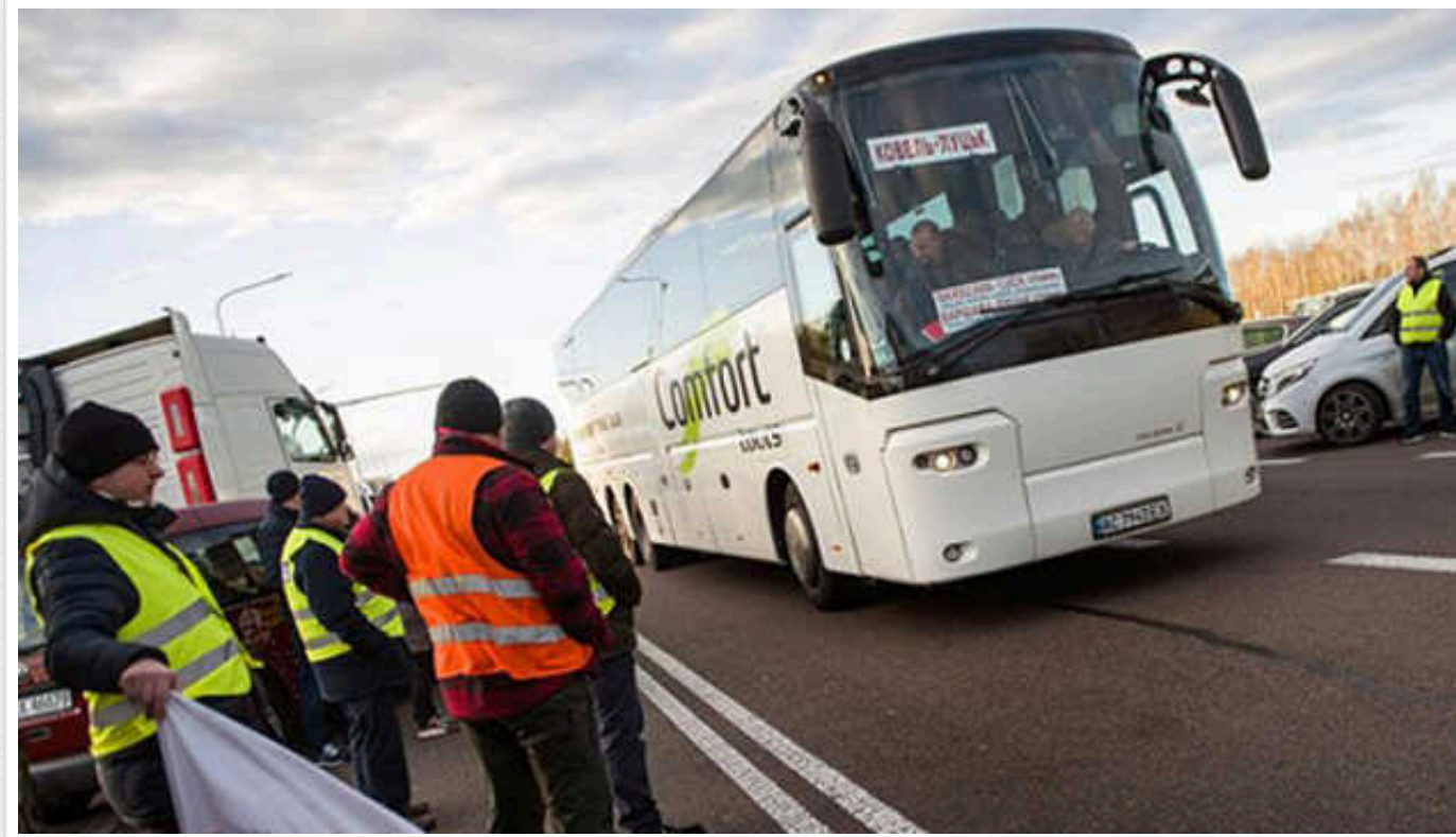
Україна закликала Польщу забезпечити безперешкодний рух пасажирських автобусів через кордон

Київ закликав Варшаву забезпечити безперешкодний рух автобусів у місця проведення протестів на польсько-українському кордоні.