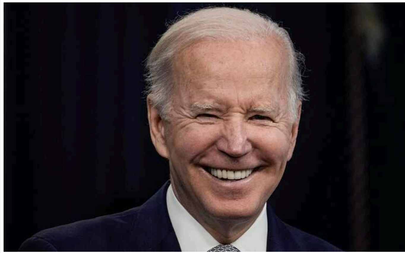
Байден: Без рішення Конгресу допомога Україні від США не зможе поновитися

Сполучені Штати Америки не зможуть відновити допомогу Україні, якщо гроші для цього не виділить Конгрес.