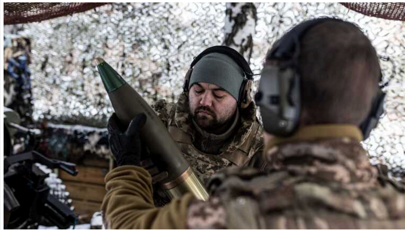
Ситуація на фронті: ворог 5 разів атакував позиції ЗСУ в районах Роботиного

За минулу добу на фронті відбулося 54 бойових зіткнення, ворог завдав 6 ракетних та 87 авіаційних ударів, здійснив 32 обстріли з РСЗВ.