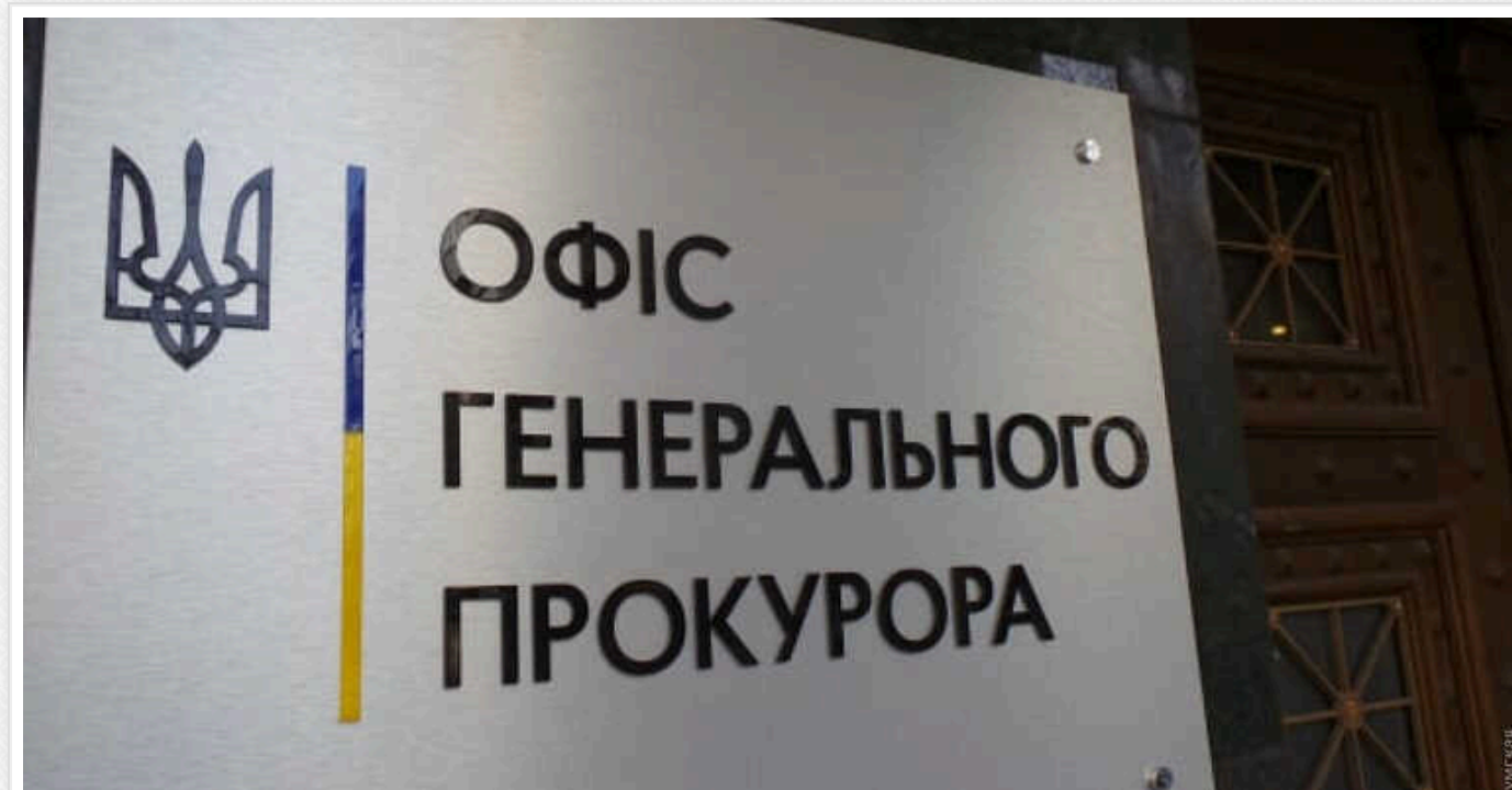
САП та НАБУ хочуть отримати право автономно вимагати екстрадицію та звинувачують Офіс генпрокурора у блокуванні їхніх запитів

"Ми працюємо над тим, щоб удосконалити механізм взаємодії НАБУ та САП з іншими юрисдикціями. Мається на увазі повноваження керівника САП надсилати запити щодо екстрадиції."