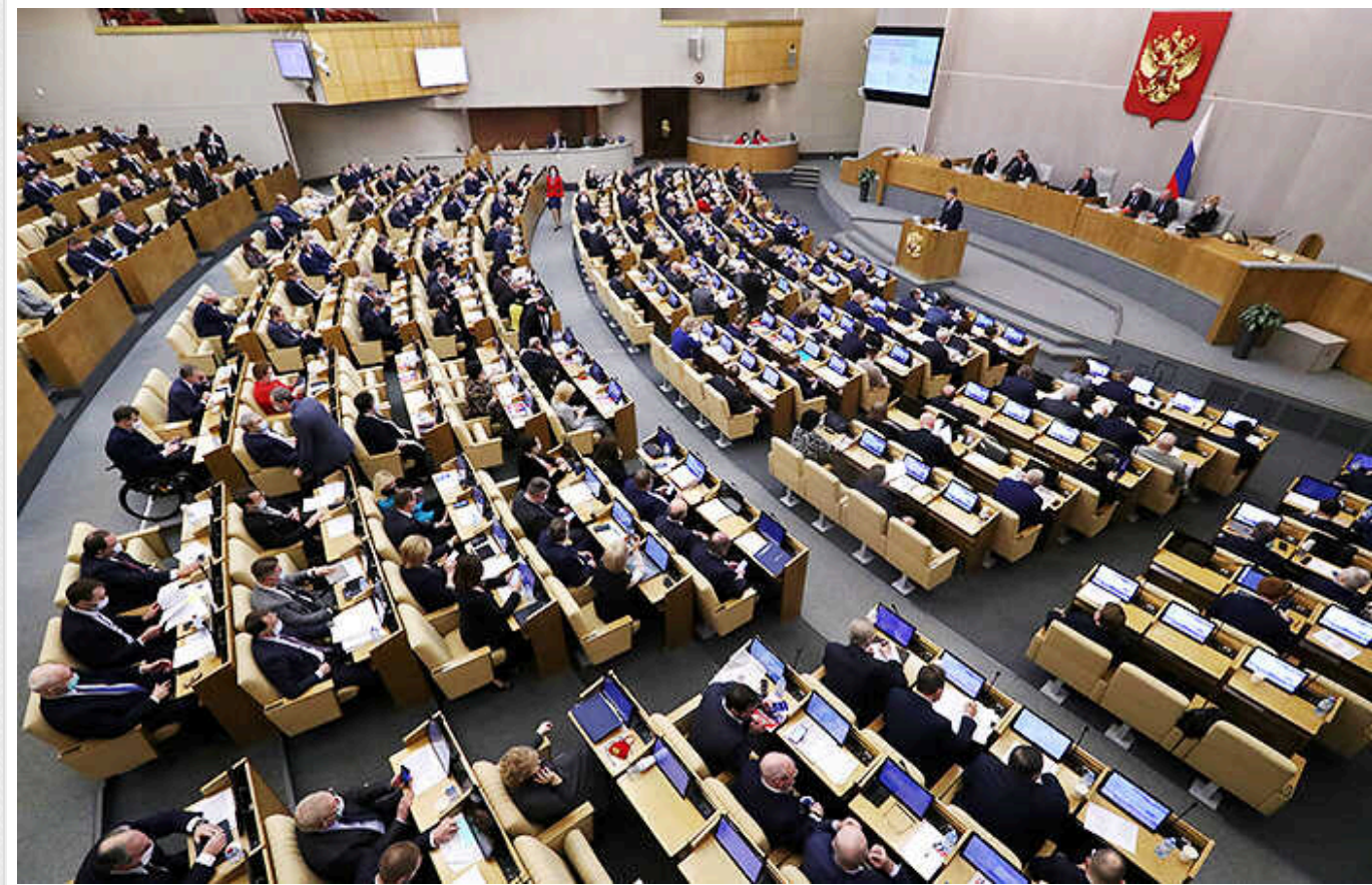
У Держдуму РФ внесли законопроект про визнання недійсним передавання Криму Українській РСР

У держдуму країни-агресора внесено законопроект про визнання недійсним рішення про передачу Криму Україні у 1954 році. Текст під назвою "про визнання недійсним рішення 1954 року про передачу Кримської області до складу УРСР" опубліковано в електронній базі законодавчого органу влади рф, передає УНН, із посиланням на росЗМІ.