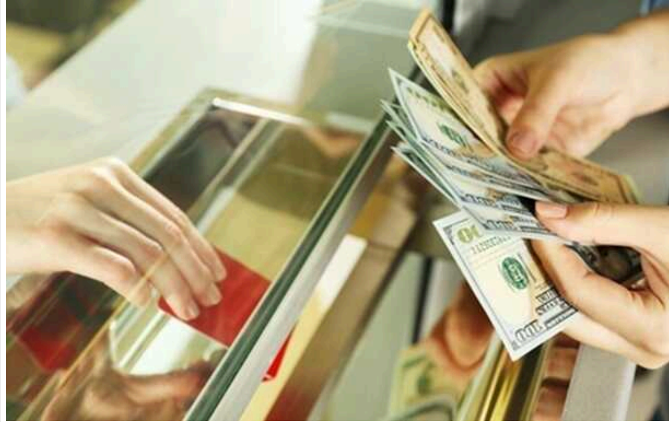
Обсяг грошових переказів в Україну значно зменшився за останні два роки