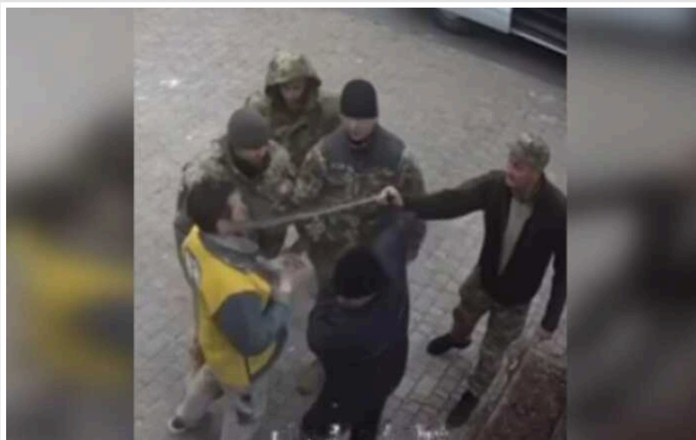
В Одесі люди у військовій формі побили чоловіків: залили газом балончиком і заштовхали в бус

Судячи з опублікованих кадрів, одного з чоловіків спершу вдарили в груди, а другому в обличчя виплеснули вміст перцевого балончика, після чого відвезли у невідомому напрямку. Доля другого чоловіка невідома.