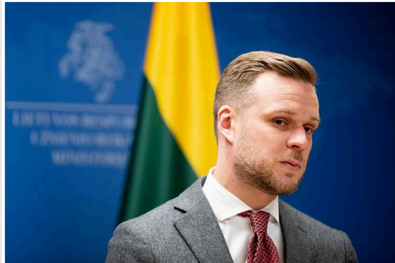
Зараз саме час, щоб обговорювати можливість відправлення військ країн Заходу для допомоги Україні, - глава МЗС Литви

Про це в інтерв'ю Ouest-France заявив міністр закордонних справ Литви Габрієлюс Ландсбергіс.