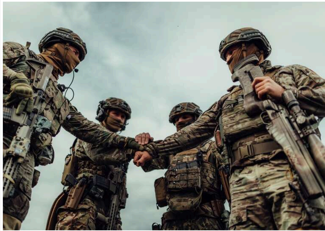
Україна дедалі ефективніше стримує наступ РФ: у Кремлі говорять про "глухий кут", – ISW

Західні чиновники все частіше звітують, що Київ дедалі активніше ставить перепони на шляху просування Росії територією України.