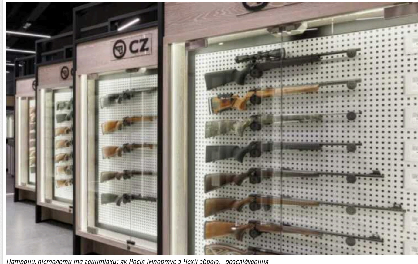
Патрони, пістолети та гвинтівки: як Росія імпортує з Чехії зброю, - розслідування

За даними журналістів, тільки у 2023 році в РФ було завезено близько двох тисяч мисливських рушниць від виробника "Slovenka zbrojovka". Автори розслідування вважають, що до постачання чеської зброї до Росії може бути задіяна Туреччина.