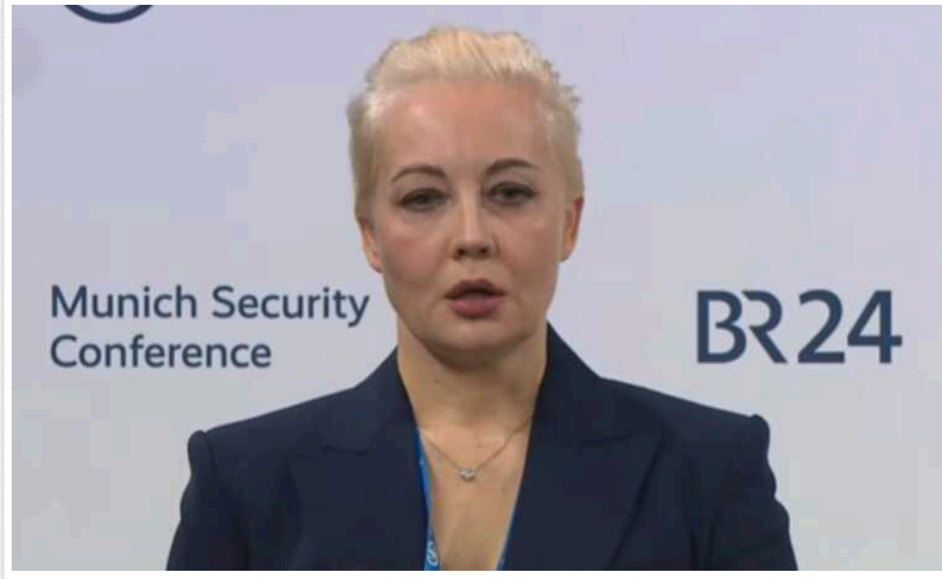
Не має конкретної мети й ресурсів: чому Зеленська не підтримала Навальну

Через нерішучість до активної боротьби з путінським режимом Зеленський не хоче зустрічатися з Ходорковським чи Каспаровим. Президент України не побачив конкретних кроків від них, окрім активності у медіасфері в інтернеті, зазначає аналітик Валентин Гладких.