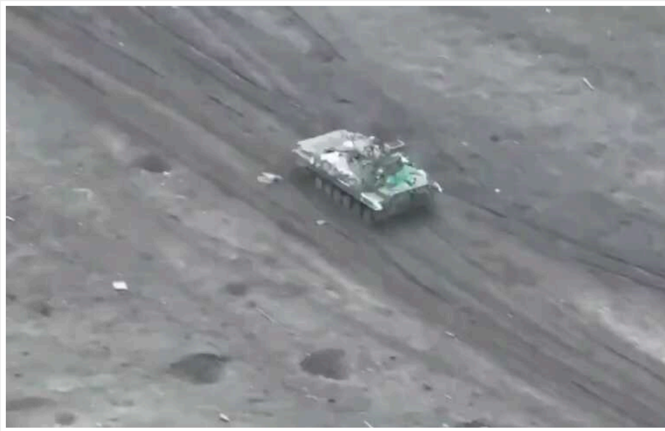
Російська БМП епічно перетворилася на пілюку

На Авдіївському напрямку вдало діють бійці 47-ї бригади, які ефектно знищили російську військову техніку. Українські військові продовжують знищувати російських окупантів та військову техніку РФ, яка опинилась на українських землях.