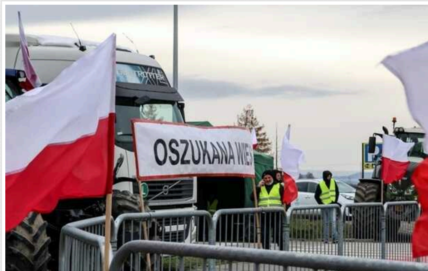
Польські протестувальники разом із поліцією почали зупиняти пасажирські автобуси з українцями на кордоні, - Кубраков

З його слів, зупиняють автобуси як на в'їзді, так і на виїзді з Польщі. Пасажирів утримують без жодних пояснень.