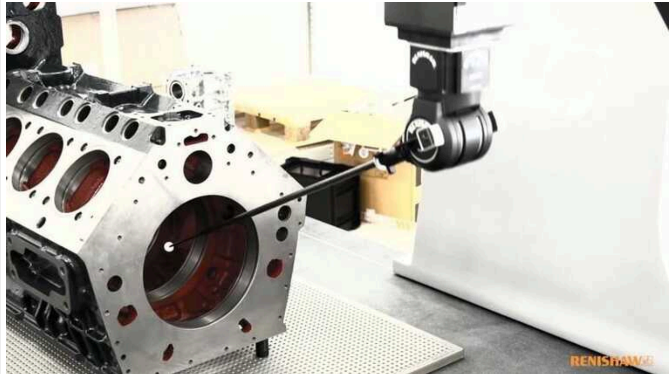
ЗМІ розповіли, як британська компанія Renishaw працює на армію російських окупантів

Британська компанія Renishaw виробляє вимірювальні системи, які контролюють якість деталей, виготовлених на металообробних станках. Таке обладнання необхідне для військово-промислового комплексу, де важлива максимальна точність, каже експерт аналітичного проєкту Rhodus Intelligence Каміль Галеєв, зазначає РосЗМІ.