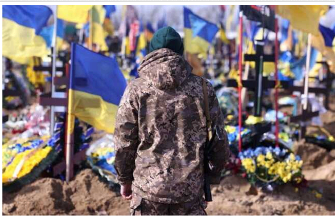
Цинізм чиновників з подачі влади поширився вже й на загиблих героїв