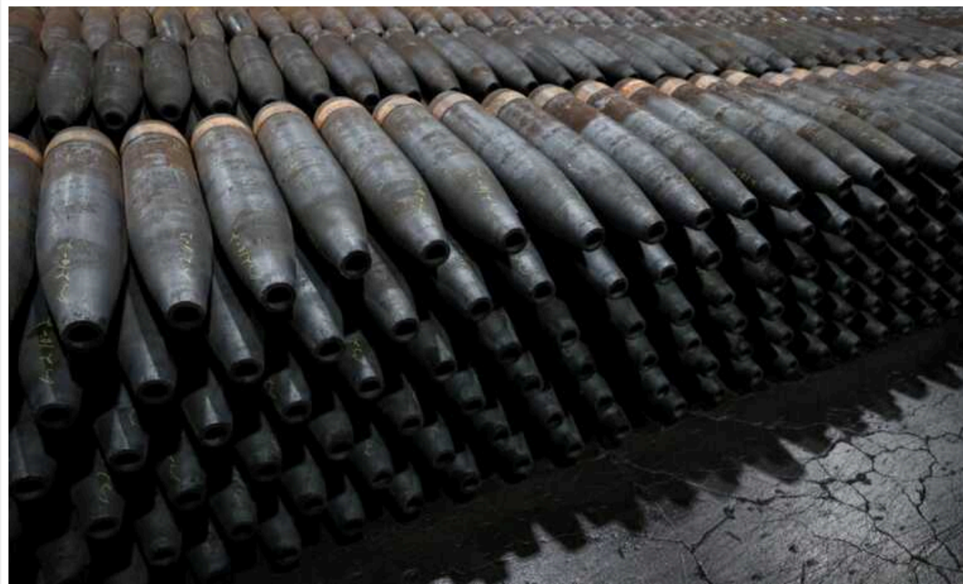
CNN: Росія виробляє в 2,5 рази більше снарядів, ніж США та Європа постачають Україні

CNN повідомляє, що РФ виготовляє майже втричі більше артилерійських снарядів, ніж США та Європа разом можуть відправити до України.