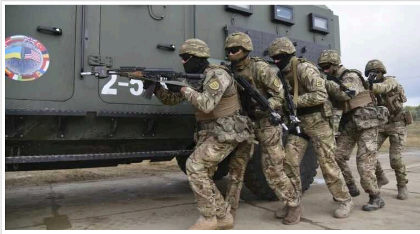
РФ поширює черговий фейк: "НАТО готується до відчайдушного кроку через поразку ЗСУ"

Російські пропагандистські ЗМІ поширюють чергову фейкову інформацію про те, що Альянс нібито готується до відчайдушного кроку через поразку ЗСУ.