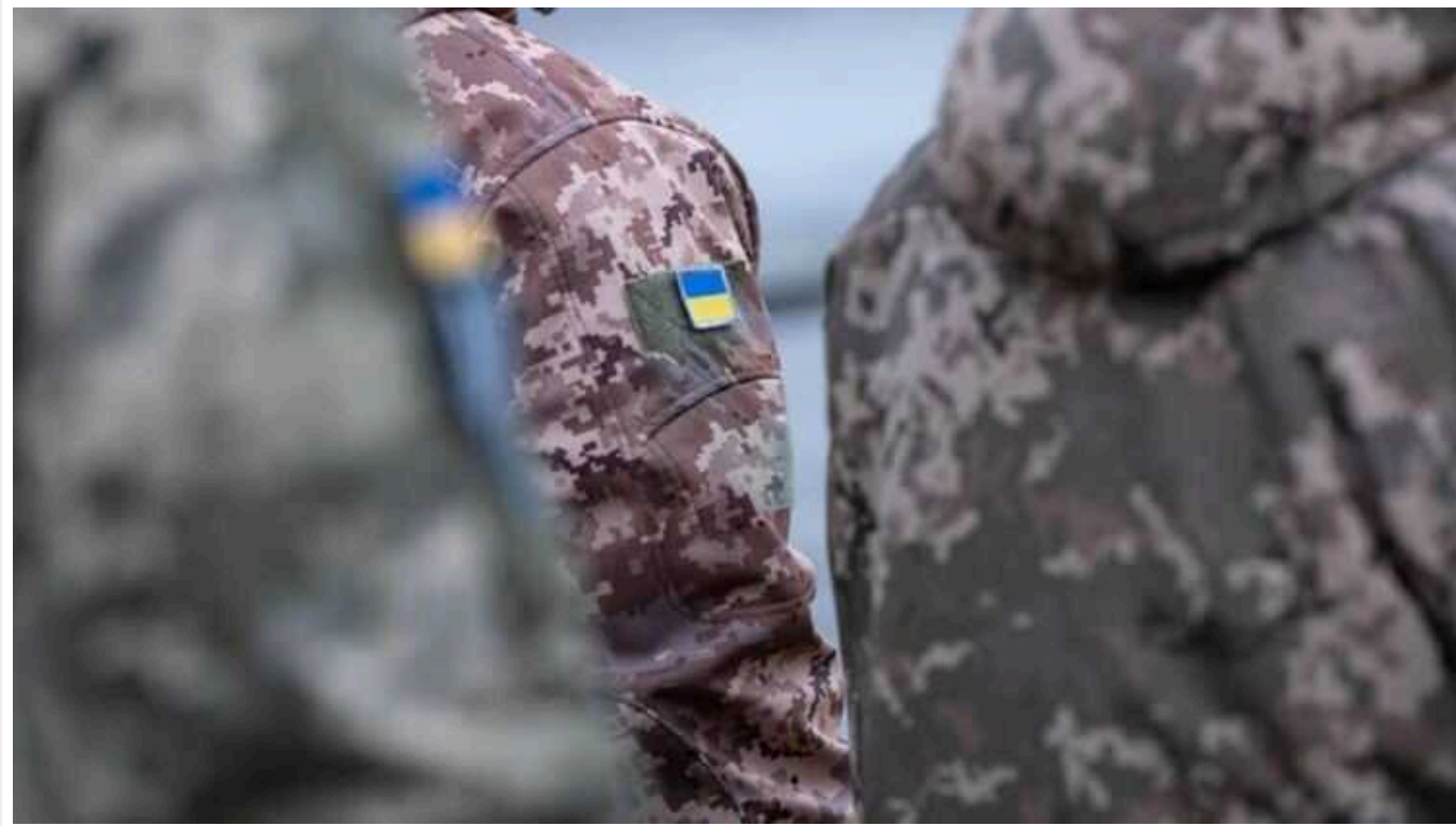
В Україні суди у 2023 році винесли 1274 вироки за ухилення від військової служби

Опендатабот повідомляє, що українські суди у 2023 році винесли 1274 вироки за ухилення від військової служби. Але лише 60 людей одержали реальні тюремні терміни.