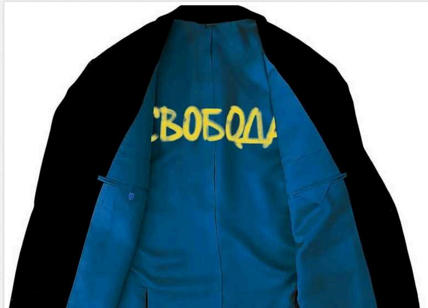
Режисер фільму "20 днів у Маріуполі" вийшов отримувати "Оскар" у костюмі з прихованим сенсом

Ніхто навіть не здогадувався, що образ українського режисера Мстислава Чернова, який приніс Україні першу перемогу в Оскарі, на кінопремії мав прихований сенс. Його неможливо було легко помітити, та коли креатор "20 днів у Маріуполі" знімав піджак, враз проглядалися жовті букви на синьому тлі.