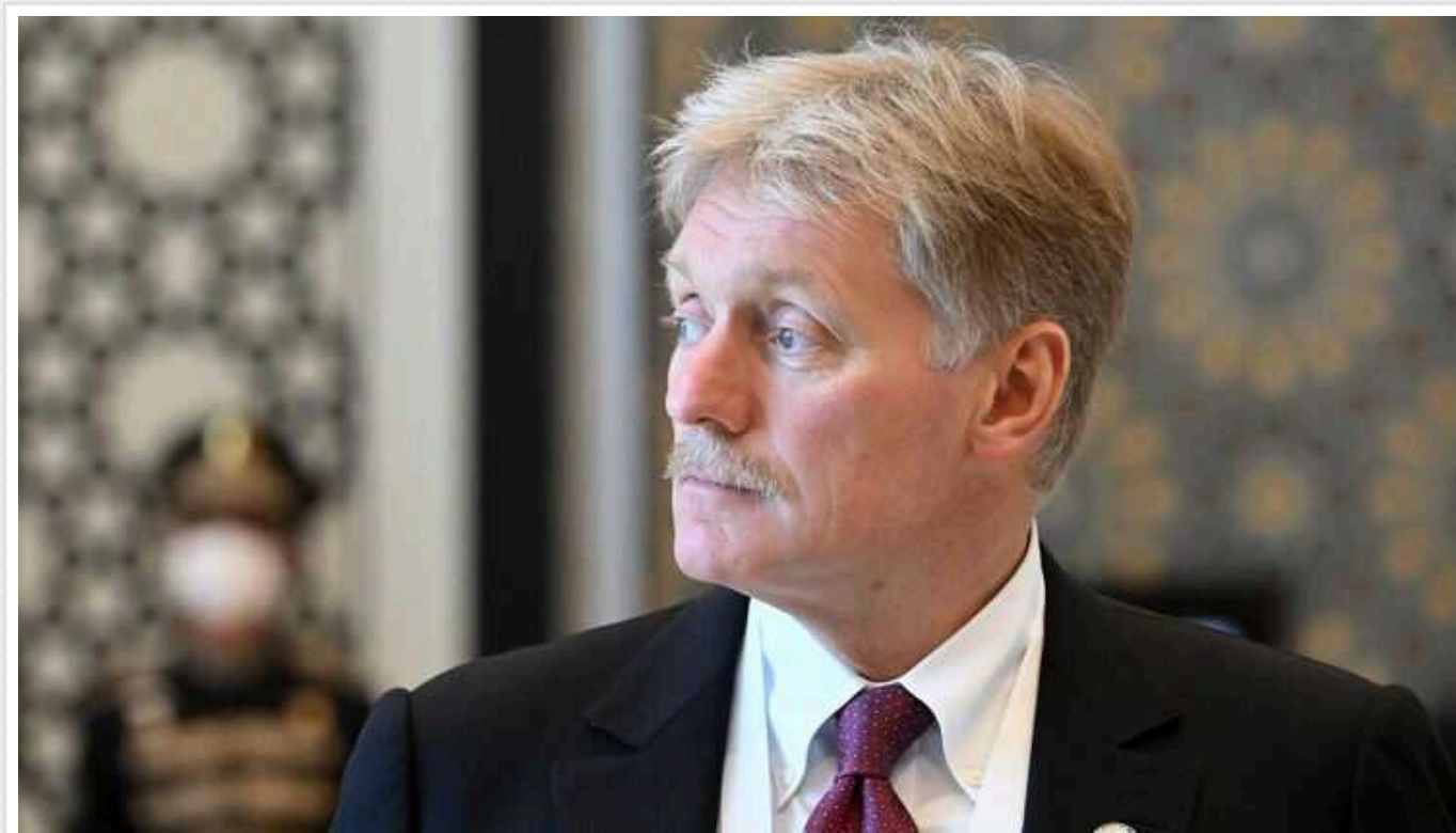
У Кремлі вимагають від МОК забути про Україну, "бо є загроза"

Міжнародний олімпійський комітет (МОК) зобов'язаний не звертати увагу на вторгнення Росії в Україну та взагалі не цікавитись цією темою. Організація також має зняти будь-які обмеження щодо представників РФ та допустити їх до змагань із національною символікою.