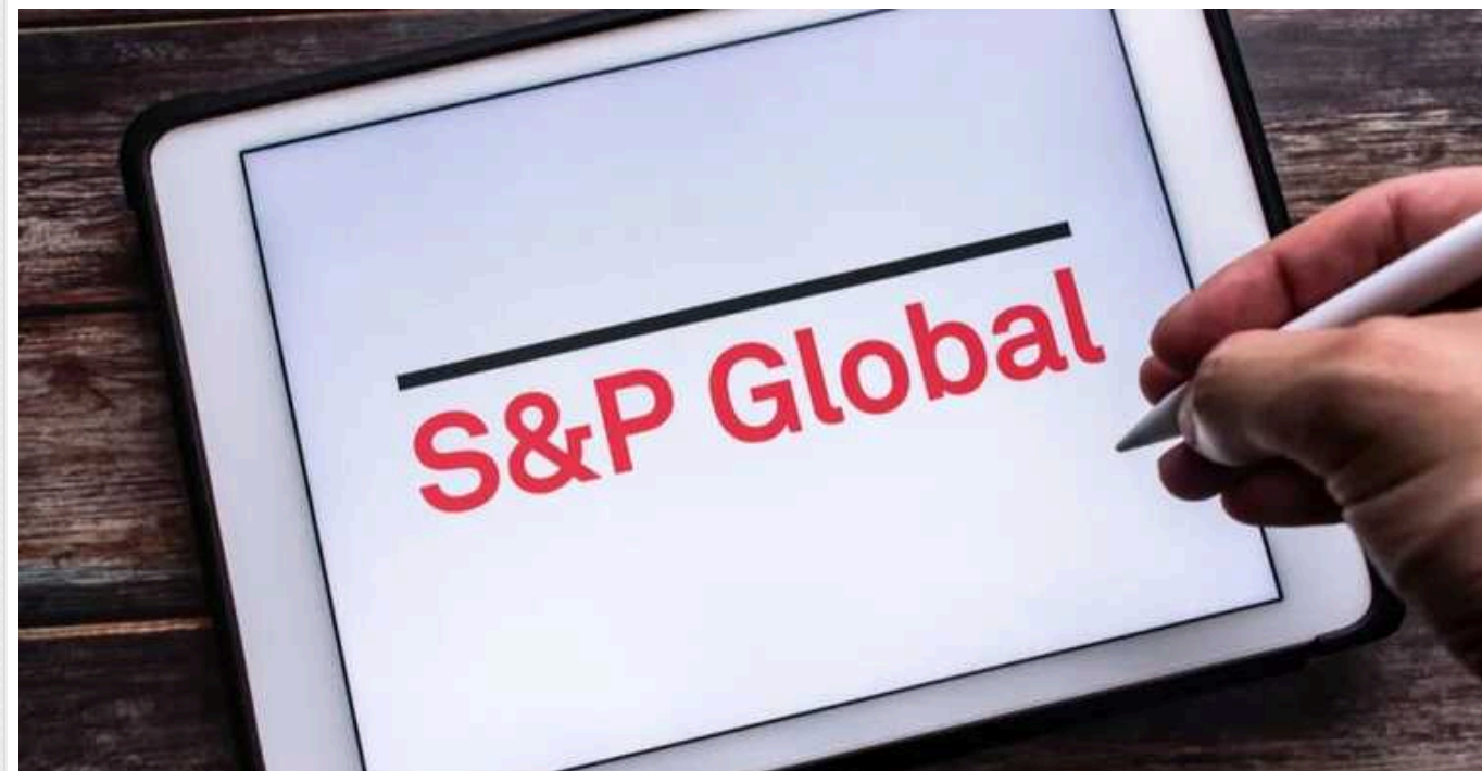
Нардеп пояснив що насправді означає "драматичне" зниження рейтингу України від S&amp;P

Зниження кредитного рейтингу України до переддефолтного рівня агентством S&P Global Ratings не є сенсацією. Зміна оцінки відбулася на тлі підготовки до реструктуризації боргів України, й інші агенції найближчим часом також знижуватимуть кредитні рейтинги нашої країни. Це зовсім не означає, що на Україну чекає фактичний дефолт (неможливість розплатитися з боргами).