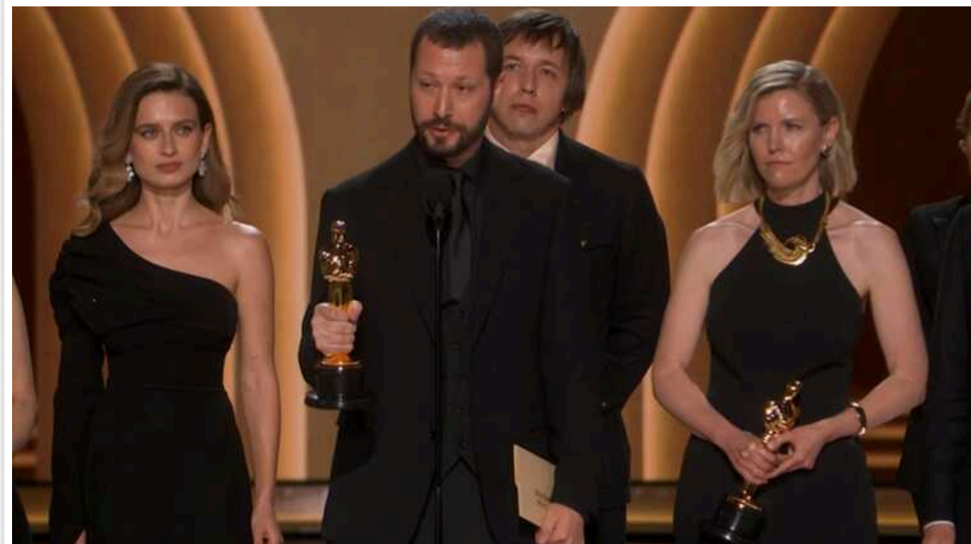
Олена Зеленська пояснила, чому "Оскар" за фільм "20 днів у Маріуполі" – надважлива перемога України

Перша леді України Олена Зеленська приєдналася до привітань української кінокоманди фільму "20 днів у Маріуполі", яка вночі отримала свій перший "Оскар". Дружина президента та громадська діячка пояснила, чому ця нагорода є надважливою для України.