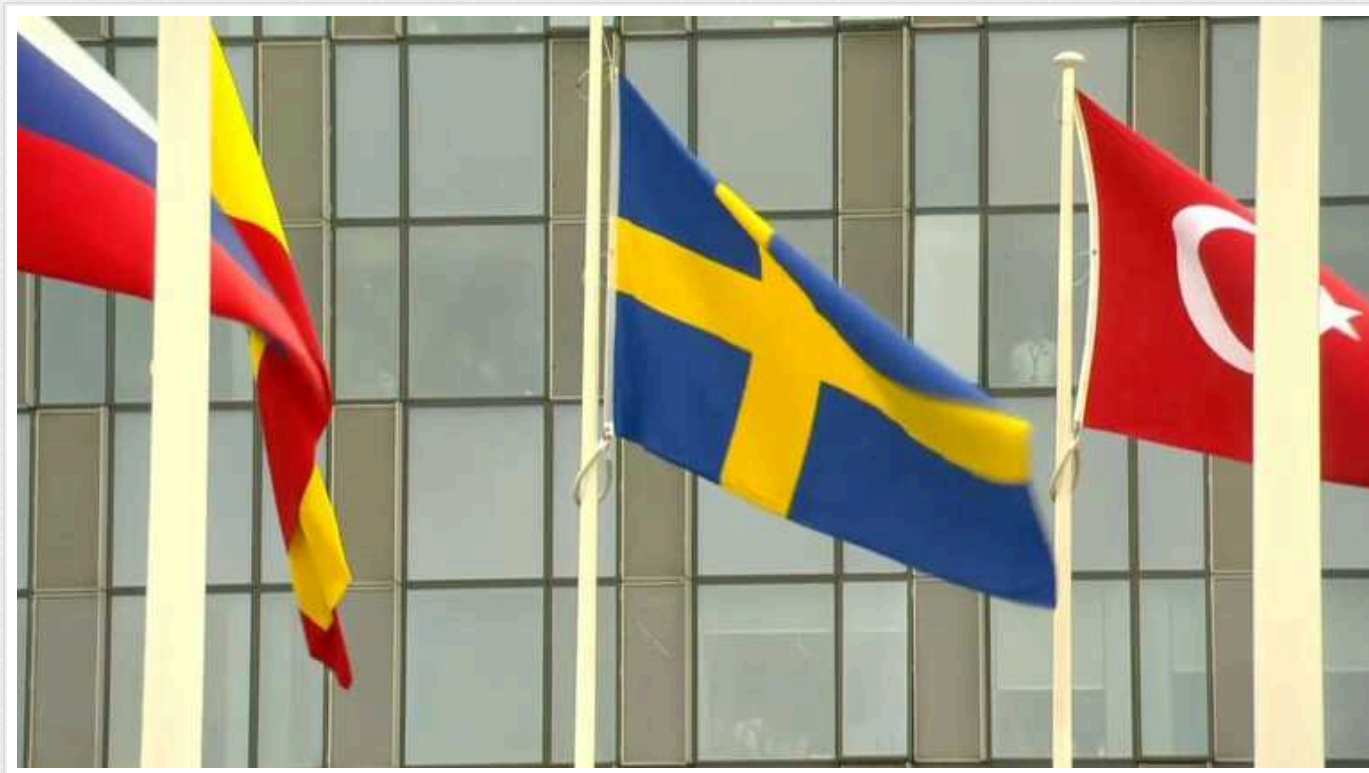
Прапор Швеції підняли біля штаб-квартири НАТО у Брюсселі

Прем'єр-міністр Швеції Ульф Крістерссон і генеральний секретар НАТО Єнс Столтенберг прибули до штаб-квартири НАТО в Брюсселі.