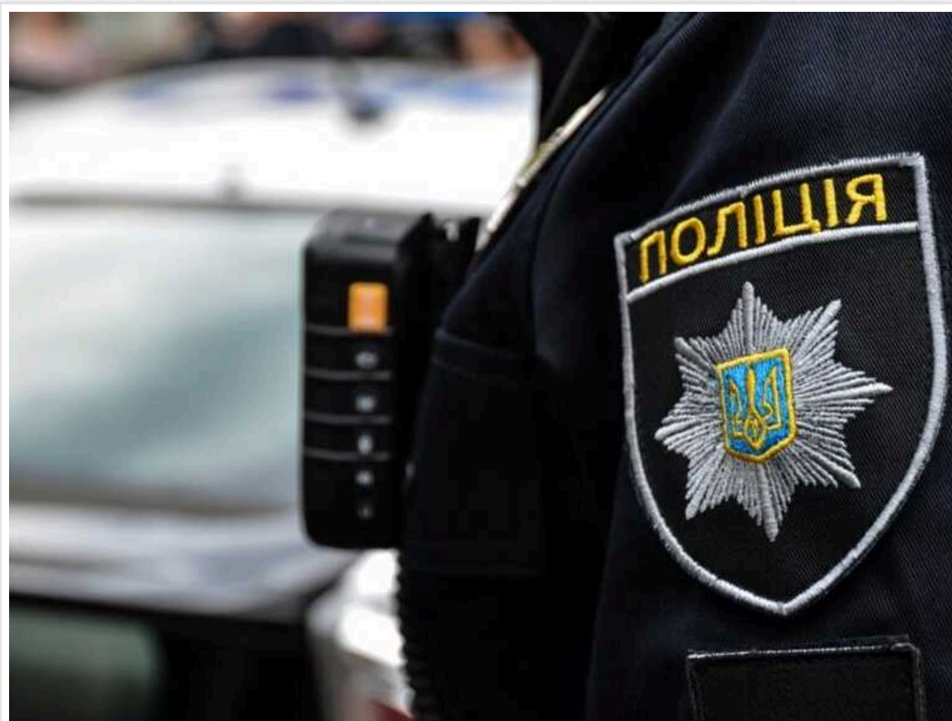
У Києві у 19-річного «бізнесмена» вилучили 2,5 кілограми наркотиків та психотропів на 500 тисяч гривень

У Києві правоохоронці викрили чоловіка, який намагався збути психотропи та наркотики. Під час обшуку в нього вилучили понад 2,5 кг "товару" на суму понад 500 тисяч гривень.