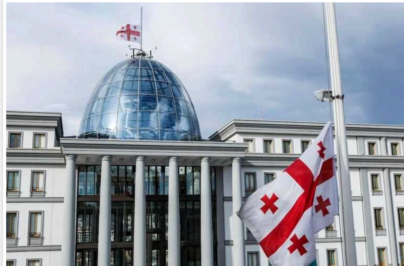
Грузія наполягає на екстрадиції двох соратників Саакашвілі, які обіймають високі посади в Україні

Грузія закликає Україну видати їй двох соратників Саакашвілі, які обіймають високі посади в Україні: радника генпрокурора Зураба Адеїшвілі та заступника голови Служби контррозвідки Георгія Лорткіпанідзе.