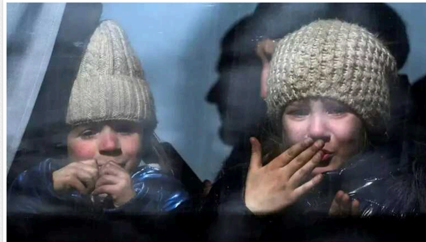
ЗМІ розповіли, як у Росії намагаються «перевиховувати» викрадених з України дітей: переконують, що батьки померли

Влада Росії розробляє систему "перевиховання" та цифрового контролю над дітьми, незаконно вивезеними з України до Росії після початку широкомасштабного вторгнення. Серед іншого, окупанти переконують маленьких українців, що їхні батьки померли.