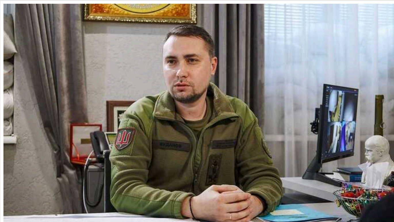
Буданов розповів про підготовку до серйозної операції в Криму: «Це наше Чорне море»

Читати на русском Read in English Додати як бажане джерело в Google