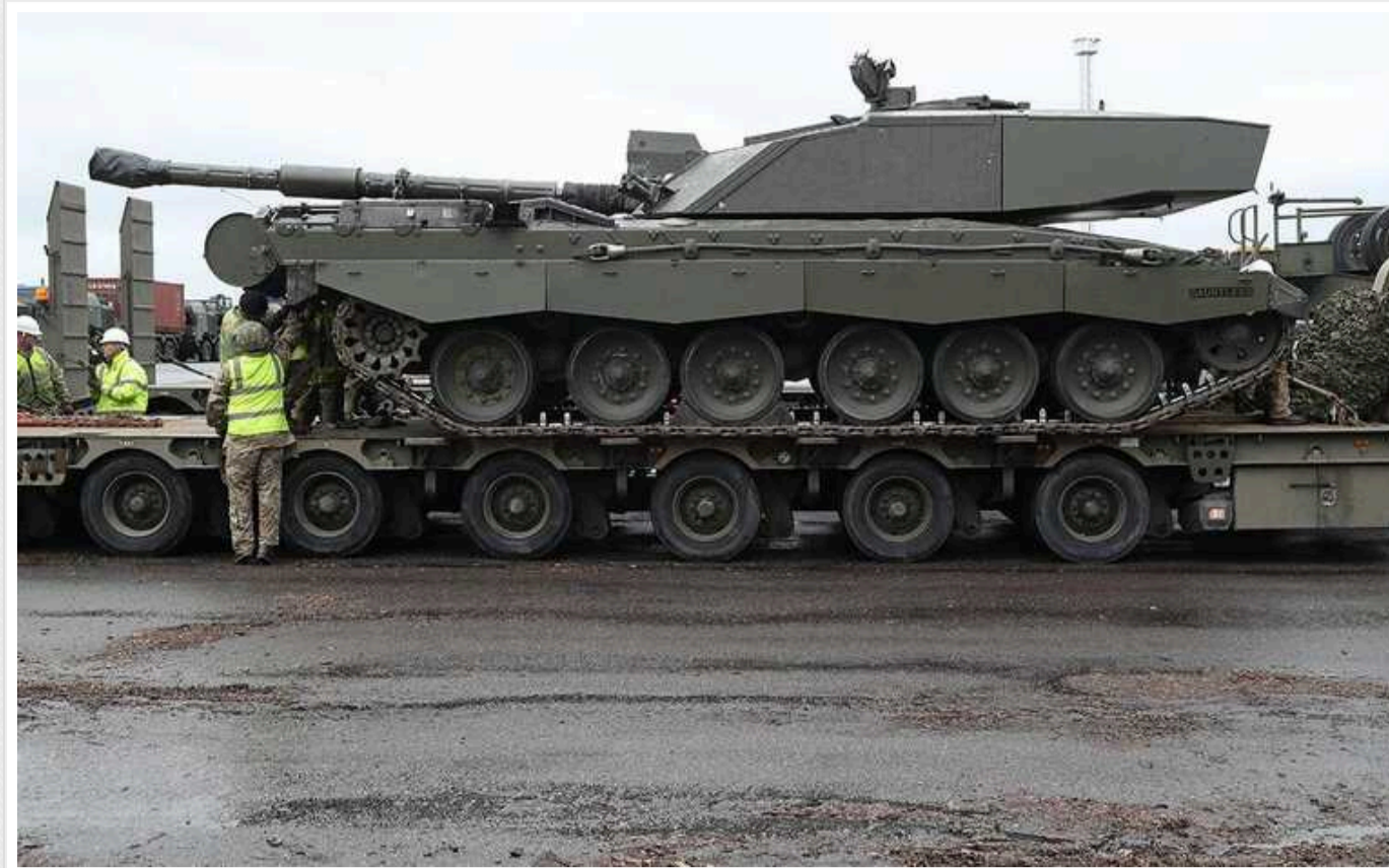
Британські танки «Челленджер 2» поки що не застосовуються в боях проти інших танків в Україні, – The Sun

Видання The Sun пише, що британські танки "Челленджер 2", передані Україні, поки що не застосовуються в боях проти інших танків. Також у них є проблеми з мобільністю – через високу масу вони застрягають у бруді.