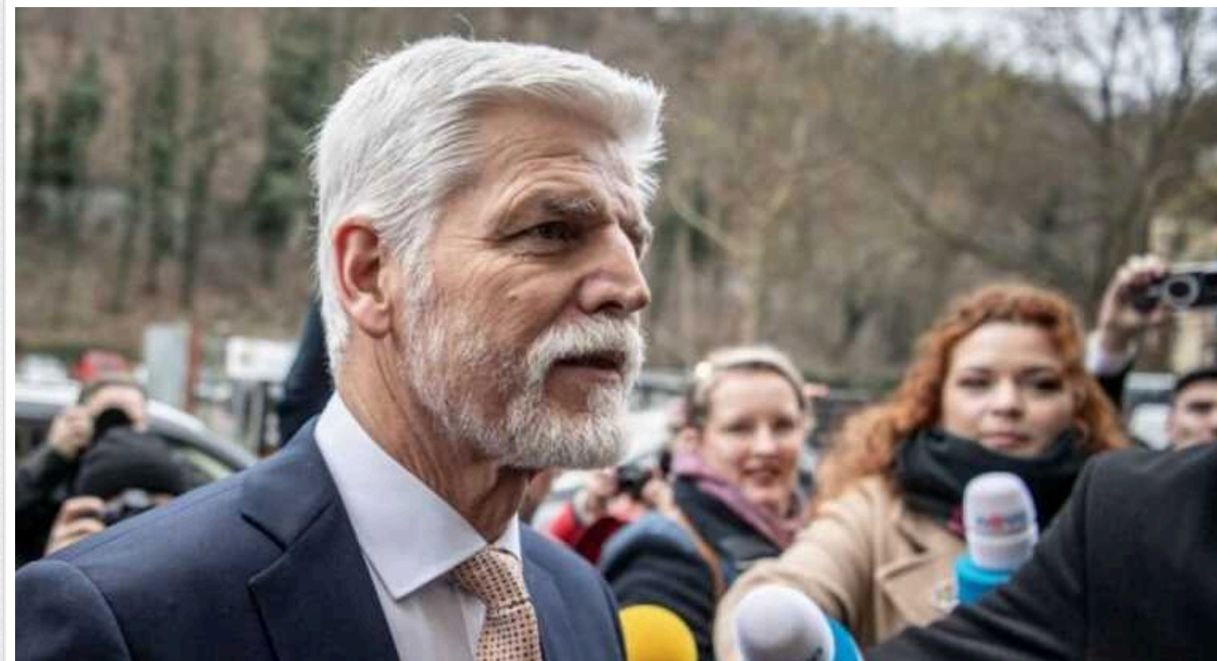
Петр Павел озвучив термін передачі 800 тисяч снарядів для України

Президент Чехії Петр Павел заявив, що закуплені в третій країнах світу 800 тис. артснарядів, можуть бути поставлені Україні впродовж кількох тижнів.