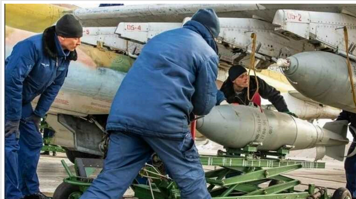
ISW: РФ розширює виробництво керованих крилатих бомб для війни проти України, але у її військ є проблеми

Країна-агресор Росія продовжує зусилля щодо розширення виробництва керованих крилатих бомб для використання у прифронтових районах України. До того ж останнім часом окупанти заважають ударів за допомогою вже вдосконаленого такого озброєння.