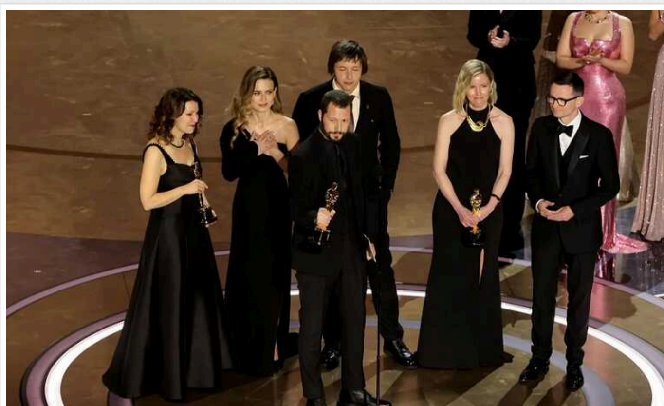
«20 днів у Маріуполі» Мстислава Чернова отримав «Оскар 2024»

Україна здобула перший в історії своєї незалежності "Оскар". Золоту статуетку отримала документальна українська стрічка, яка розповідає про трагедію Маріуполя, що на Донеччині, під час повномасштабного російського вторгнення 2022 року – "20 днів у Маріуполі".