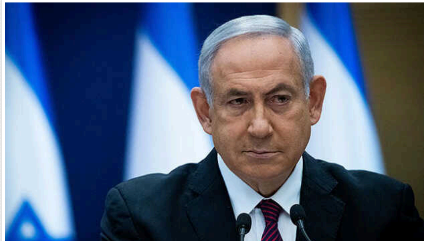
Ізраїль знищив три чверті терористичних батальйонів ХАМАСу, – Нетаньягу

Прем'єр-міністр Ізраїлю Біньямін Нетаньягу заявив, що для завершення війни в Секторі Гази потрібно «не більше двох місяців».