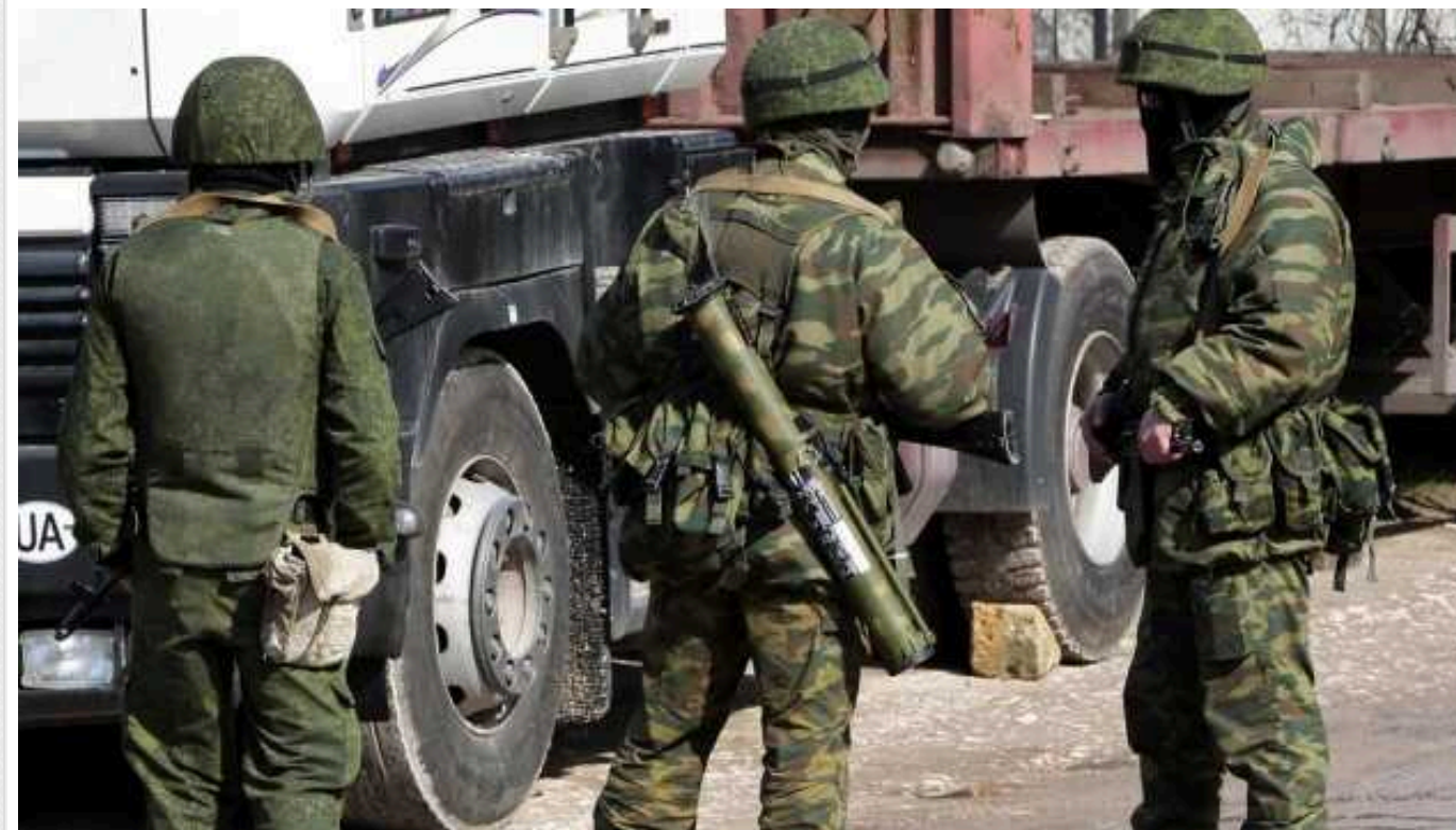
На окупованій Луганщині посилили перевірки на блокпостах через «вибори» в Росії

На окупованих територіях Луганської області російські загарбники посилили перевірки на блокпостах через «вибори» президента РФ.