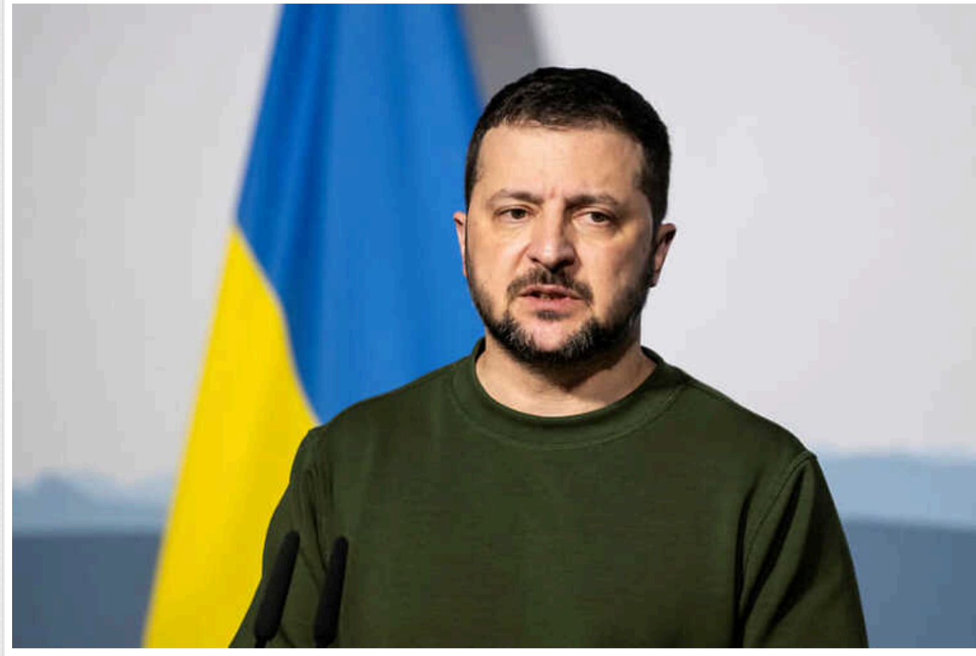
Зеленський: Російські вбивці не йдуть далі Європою, тому що їх стримують українці

Російські вбивці та катівні не просуваються далі Європою тільки тому, що їх стримують українці й українки зі зброєю в руках та під синьо-жовтим прапором.