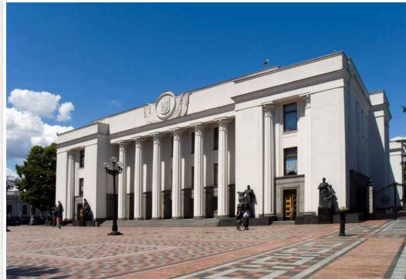
Наступного тижня Рада почне розглядати поправки до законопроекту про мобілізацію, – Арахамія