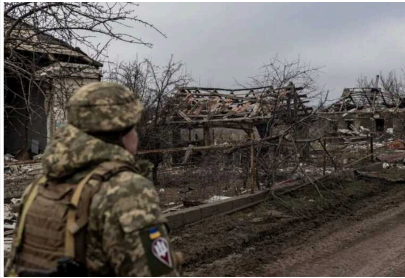
Нові російські авіабомби змінили баланс сил на фронті, – CNN

Мова йде про ФАБ-1500 – "напівторатонну зброю, половина якої складається з фугасної вибухівки. Вона скидається зверху винищувачами з відстані приблизно 60-70 кілометрів, поза досяжністю багатьох українських систем ППО".