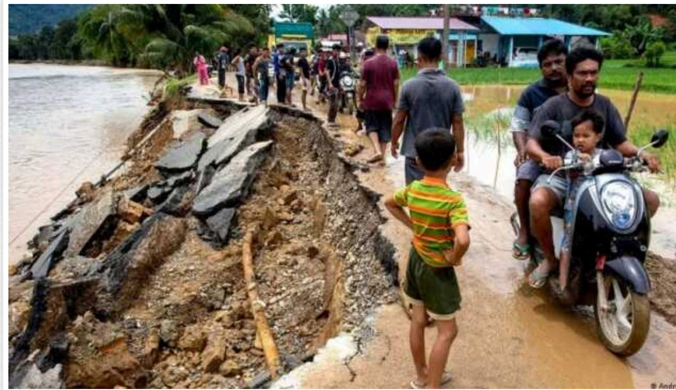
Повінь в Індонезії: кількість загиблих зросла до 21, понад 80 тисяч людей евакуювали

Унаслідок повеней в індонезійській провінції Західна Суматра загинула 21 людина, ще понад 80 тисяч осіб було евакуювано.