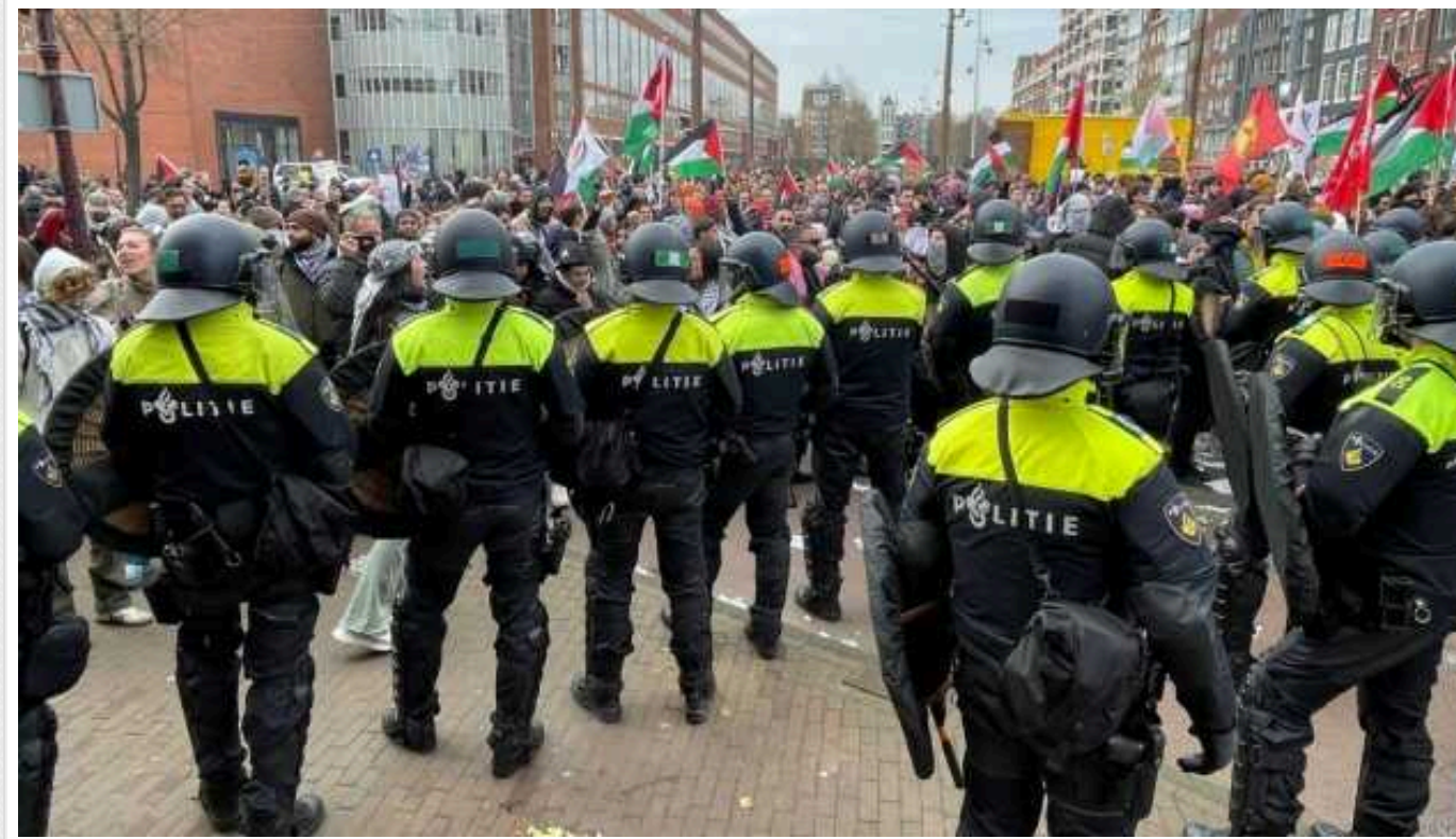
В Амстердамі відбулися протести через участь президента Ізраїлю у відкритті Музею Голокосту

В Амстердамі тисячі людей вийшли на вулиці, щоб висловити протест через приїзд президента Ізраїлю Іцхака Герцоґа для участі в церемонії відкриття Національного музею Голокосту.