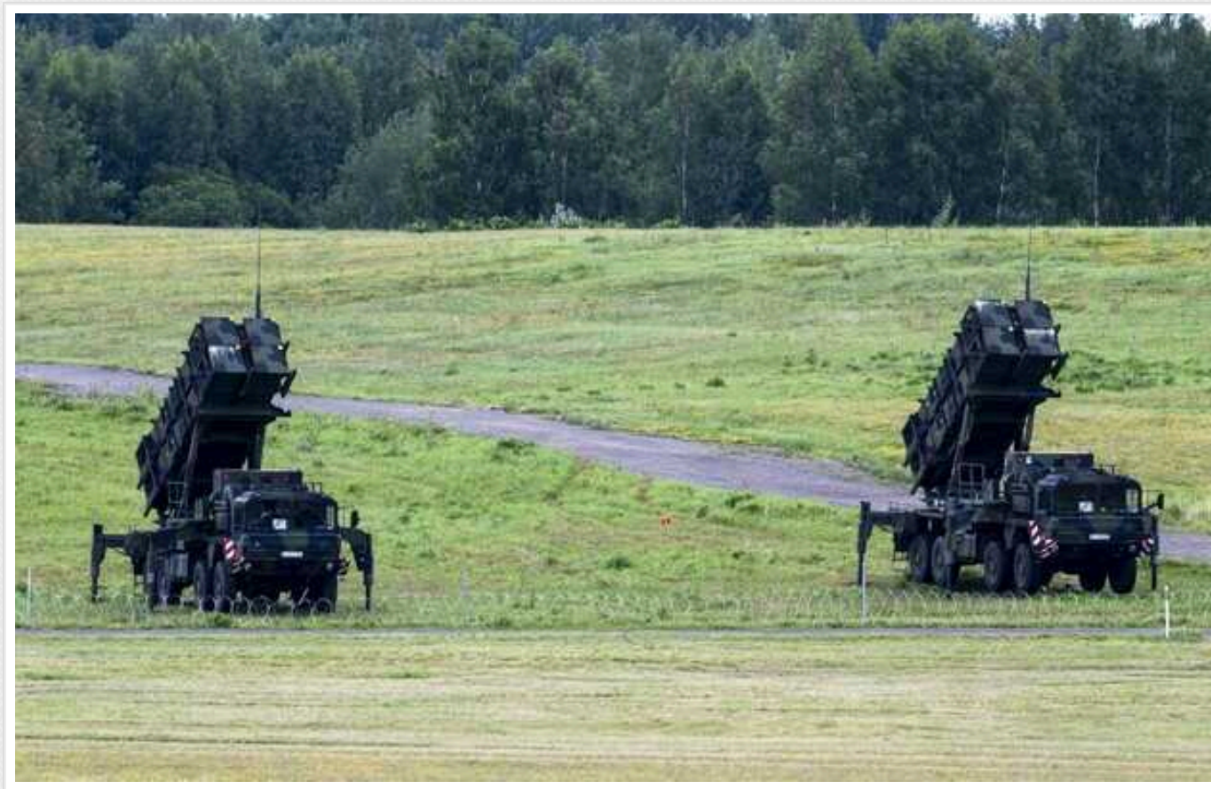
НАТО переміщує ракети ближче до кордонів із РФ

Країни НАТО впроваджують ротаційну модель протиповітряної оборони в Литві. Там буде розміщено зенітно-ракетні комплекси Patriot.