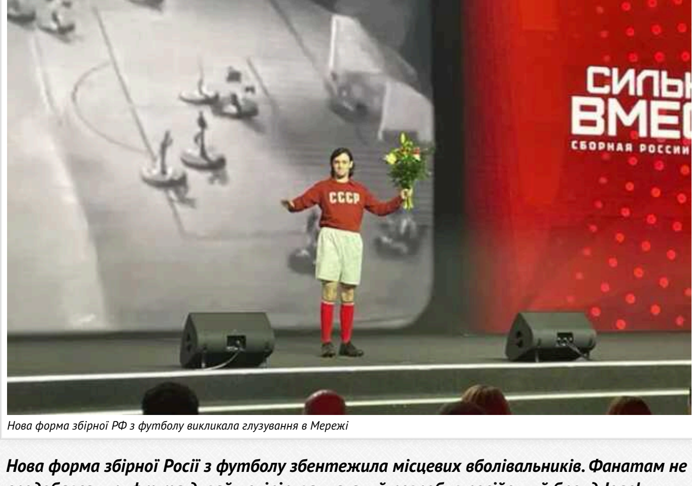
Нова форма збірної РФ з футболу викликала глузування в Мережі

Нова форма збірної Росії з футболу збентежила місцевих вболівальників. Фанатам не сподобався шриффт та дизайн екіпірування, який розробив російський бренд Jogel.