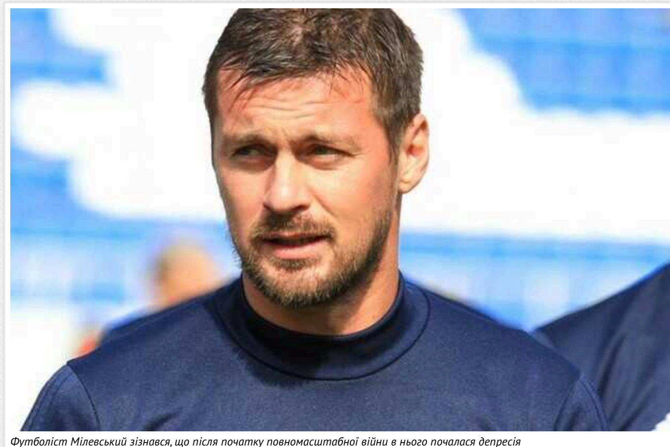
Футболіст Мілевський зізнався, що після початку повномасштабної війни в нього почалася депресія

Колішній гравець футбольного клубу "Динамо" та збірної України Артем Мілевський зізнався, що після початку повномасштабної війни в нього почалася депресія, і він почав вживати багато алкоголю.