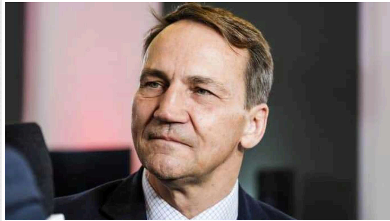
Глава МЗС Польщі запропонував Папі Римському закликати Путіна вивести армію з України

Це відбулося після скандальної заяви понтифіка про те, що Україна має вивісити білий прапор, і провести перемовини з РФ.